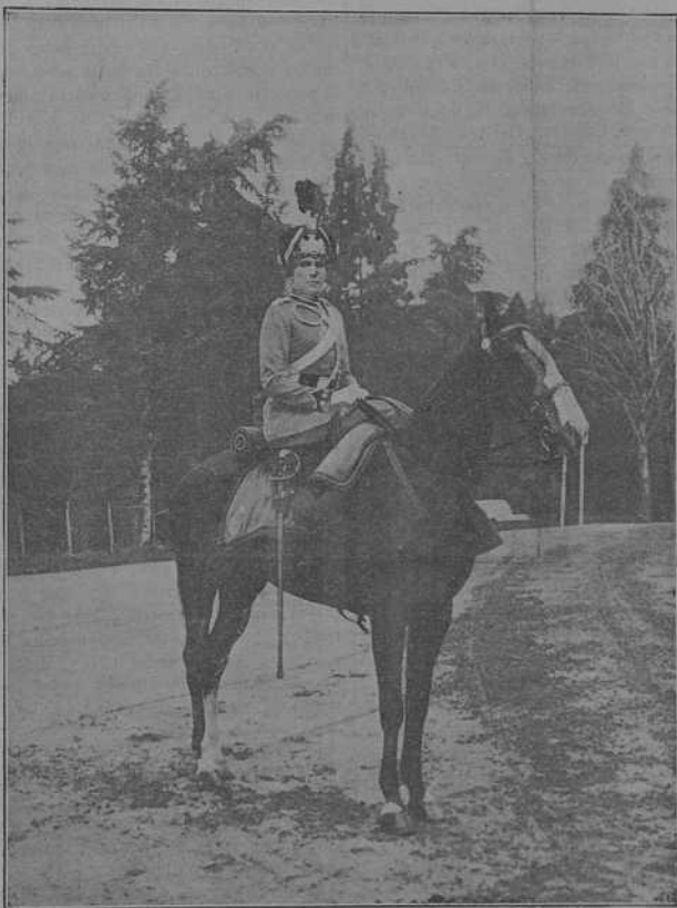
S. M. la Reina con el uniforme de Coronel del regimiento de Cazadores de Victoria Eugenia.

El mismo ruego se ha hecho a los diputados y senadores de la provincia.