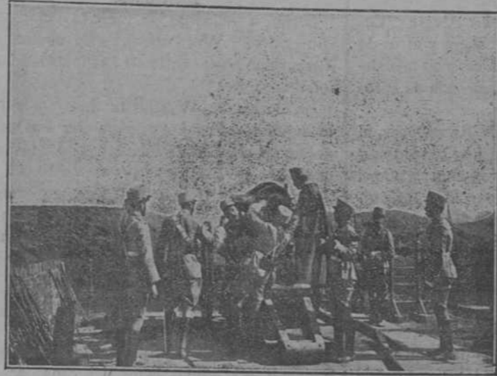
Los alumnos de la Academia de artillería cargando un obús.

La reunión, convocada con carácter extra-