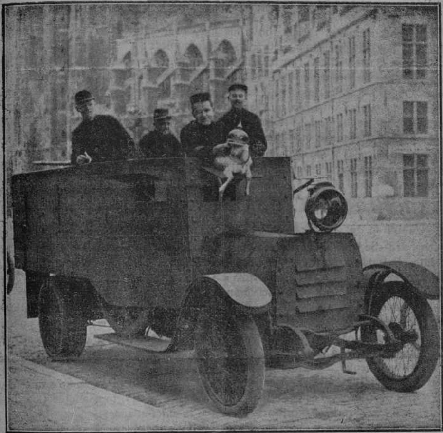
AUTOMÓVIL BLINDADO DEL EJÉRCITO BELGA

La Historia exigirá en su día la responsabilidad de haber desencadenado tal tormenta a los verdaderos culpables; la generación presente no puede hacer más que resignarse a la difícil