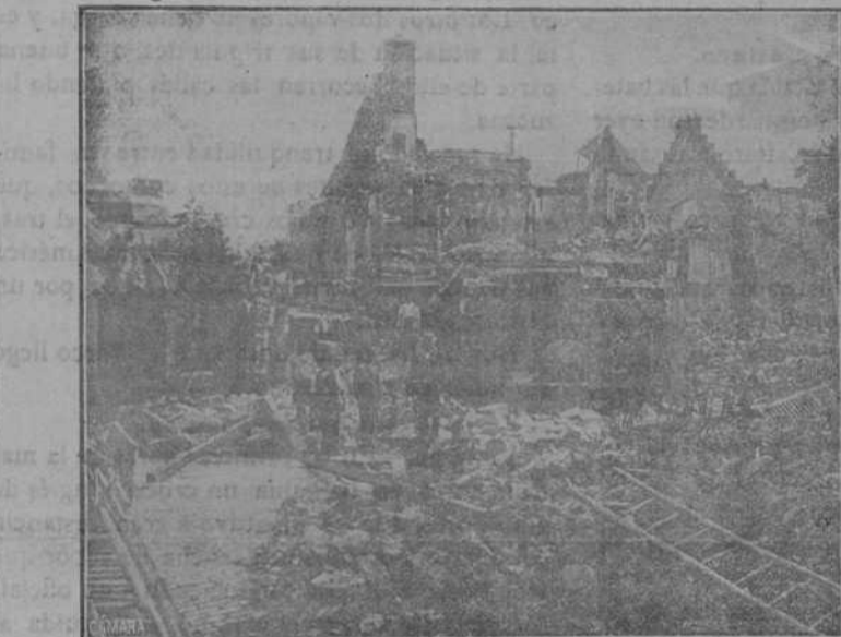
SENLS. VISTA DEL BARRIO DE LICORNE, DESTRUIDO POR LOS DISPAROS DE LA ARTILLERÍA ALEMANA

En cambio España se ha encontrado al estallar un conflicto, esperado desde hace cincuenta años, con que sus dilatadas costas están á merced de cualquiera, y que le sería imposible continuar su empresa africana al menor gesto de los que imponen su voluntad en los mares.