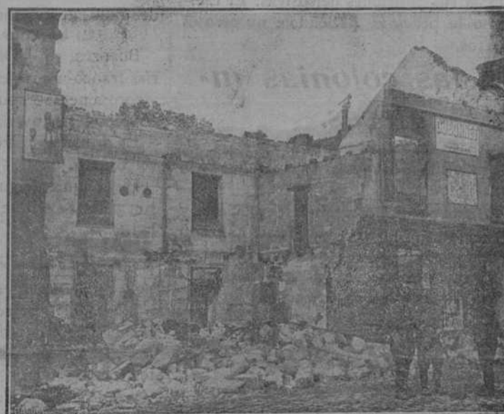
MEAUX. CASAS DESTRUIDAS POR LOS DISPAROS DE LA ARTILLERÍA ALEMANA EN LAS CERCANÍAS DE LA POBLACIÓN