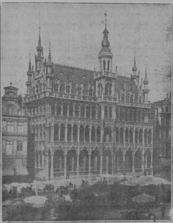
CASA DEL REY DE BÉLGICA EN BRUSELAS

Tres Cuerpos de ejército alemanes sufrieron una derrota tremenda.