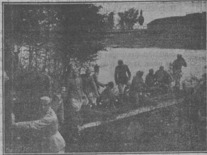
Lanzamiento al agua de la balsa construída por los alumnos para atravesar el Duero.

Día 4.—Acusadores de puntería peligrosa y funcionamiento de torres y ascensores.