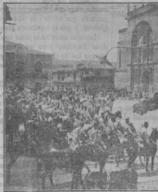
El escuadrón de alumnos de la Academia de Caballería de Valladolid, oyendo misa de campaña en la plaza de Tuleja de Duero, adonde fueron a efectuar prácticas.

Dan cuenta las respectivas autoridades militares que no ocurre novedad en dichas plazas ni en sus posiciones.