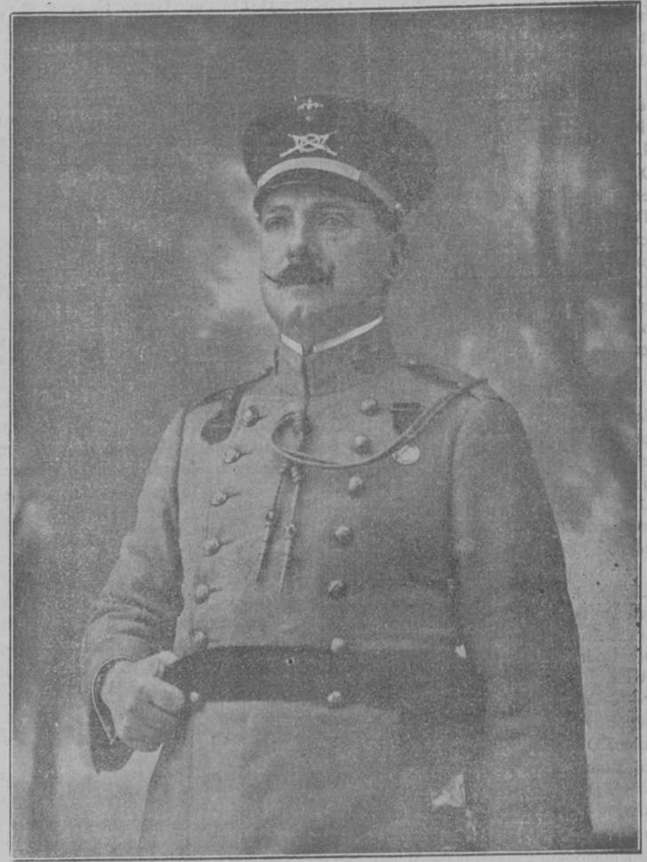
EXCMO. SR. GENERAL DE BRIGADA D. SEVERIANO MARTÍNEZ ANIDO

Terminado el almuerzo que le ofreció el general Jordana en la citada posición, a la que se incorporaron oportunamente los demás jefes que le acompañaban y los de las fuerzas concentradas en el Zaio, celebraron una conferencia, reinando entre ellos la mayor armonía y compañerismo.