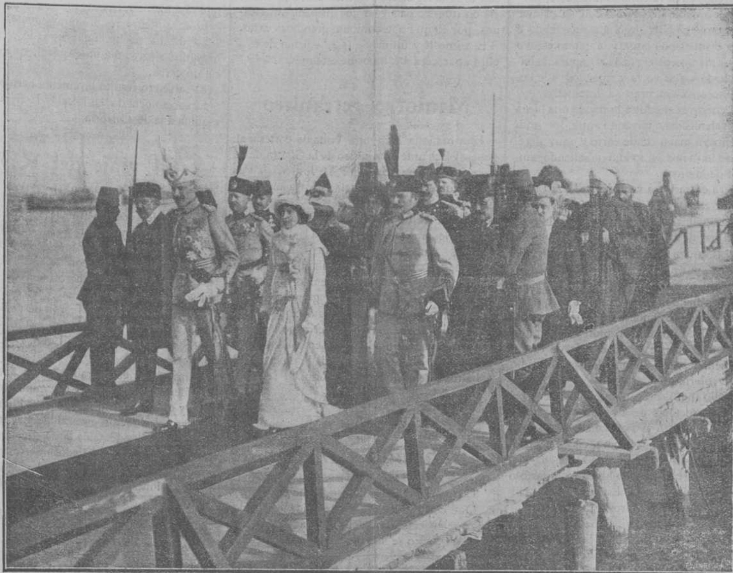
LLEGADA DE LOS SOBERANOS DE ALBANIA A LA CAPITAL DE SU REINO

Entraron dos barcos de guerra españoles con un desplazamiento de 2.600 toneladas y seis cañones, y uno extranjero con 6.500 toneladas y 24 cañones, y 93 buques mercantes con un