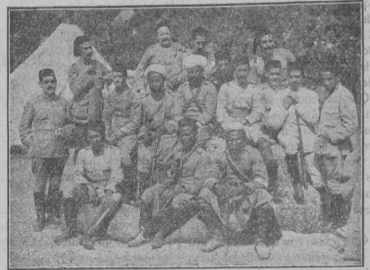
INDIVIDUOS DE LAS FUERZAS REGULARES INDÍGENAS ASCENDIDOS A SARGENTOS POR MÉRITOS DE GUERRA EN LOS ÚLTIMOS COMBATES

De Tetuán, Ceuta y Larache participan no ocurrir novedad, añadiendo que en la primera de dichas plazas continúan dificultando las comunicaciones las persistentes lluvias.