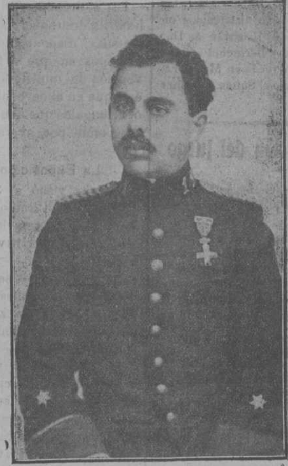
D. Vicente Morales, teniente de San Fernando, que sucumbió gloriosamente en el combate del 13 de Mayo último.

do ex profeso á hollarlo con sus plantas, á respirar su oxígeno, á contemplar su horizonte; y en el más dulce de los éxtasis, han meditado, han oído del susurro del viento, el eco de aquellos héroes que en su perduran conviviendo con todos nosotros y especialmente con nuestros predecesores honorarios, tales como el diputado del Congreso argentino doctor E. S. Zaballo, y el diputado del Congreso español D. Manuel de Burgos.