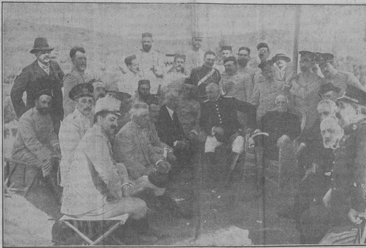
Generales y Profesores descansando.