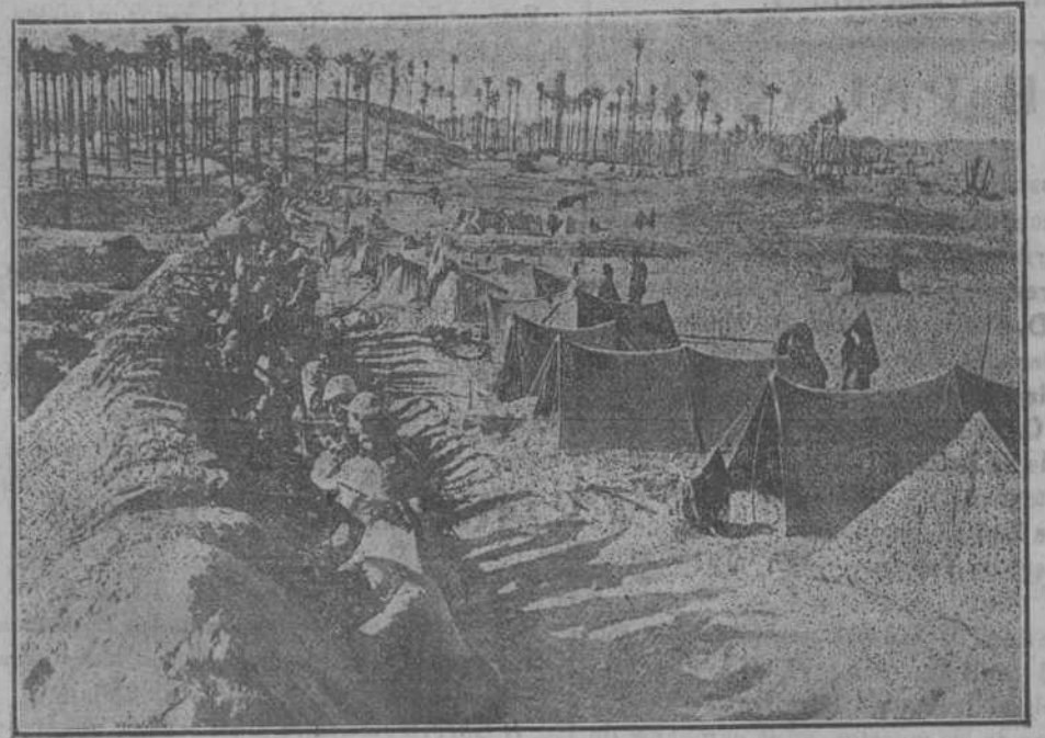
El campo atrincherado italiano de Ain-Zara, al sur de Trípoli.

El torpedero, la experiencia ha demostrado, y nosotros no podemos admitir otra cosa aun respetando mucho la opinión de almirantes como Fournier, no ha servido más que como auxiliar de la escuadra, ni podría servir de otro modo; la enseñanza que hemos sacado de todas las guerras, desde la de los Estados Unidos del Norte con los del Sur, en que se utilizó el torpedo de botalón, hasta nuestros días, es que siempre los torpederos han operado apoyados por los buques de combate. En estas guerras, con tanta enseñanza nos han dejado y que han venido a resolver una gran lucha industrial que durante más de medio siglo se ha estado sosteniendo, y a muchas naciones ha hecho ser vencidas por obrar de ligero y buscar extremos no justificados, hemos visto la eficacia de los torpederos.