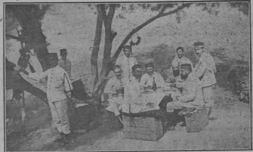
MELILLA: Jefes y oficiales del Batallón de Ciudad Rodrigo en la posición de Yadumen.

Añádesse que Rusia, al proponer á la Puerta abrir los estrechos á sus buques de guerra, la ofreció como compensación anular el Convenio que concede á Rusia el derecho exclusivo, á excepción de Turquía, á construir líneas férreas en el territorio del mar Negro.