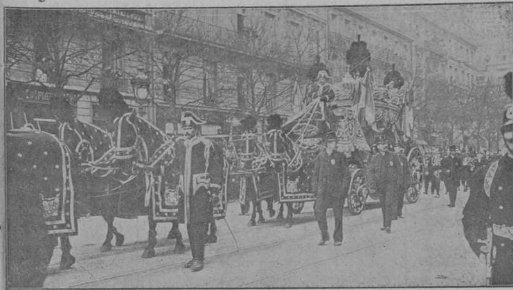
El entierro del Ministro de la Guerra francés, general Brun: El cortejo fúnebre atravesando las calles de París.

Los lectores que deseen conocer datos para formar juicio, pueden encontrarlos en la obra editada por el Congreso, cuyos principales documentos están en el libro que se titula «Causa contra Francisco Ferrer Guardia, instruida y fallada por la jurisdicción de Guerra en Barcelona». Este libro necesita largo y detenido análisis, que supone en quienes lo hayan realizado muchos días de estudio y una labor crítica nada fácil. En sus 706 páginas aparecen las diligencias preliminares para formación de pieza separada que dió lugar al proceso contra Ferrer. Siguen las declaraciones y documentos desglosados del proceso general: la copia de los documentos encontrados en el «Mas Germinal», las declaraciones de los testigos citados por Ferrer, la detención y reconocimiento de éste, el atestado instruido en Premiá de Mar, el sumario incoado en Mataró, numerosos atestados de la Policía, las actuaciones del Juzgado en Premiá, Mataró,