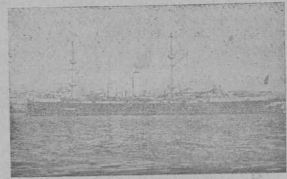
El crucero de guerra portugués «San Rafael»

Nosotros hemos visto, ya lo ha dicho elo-