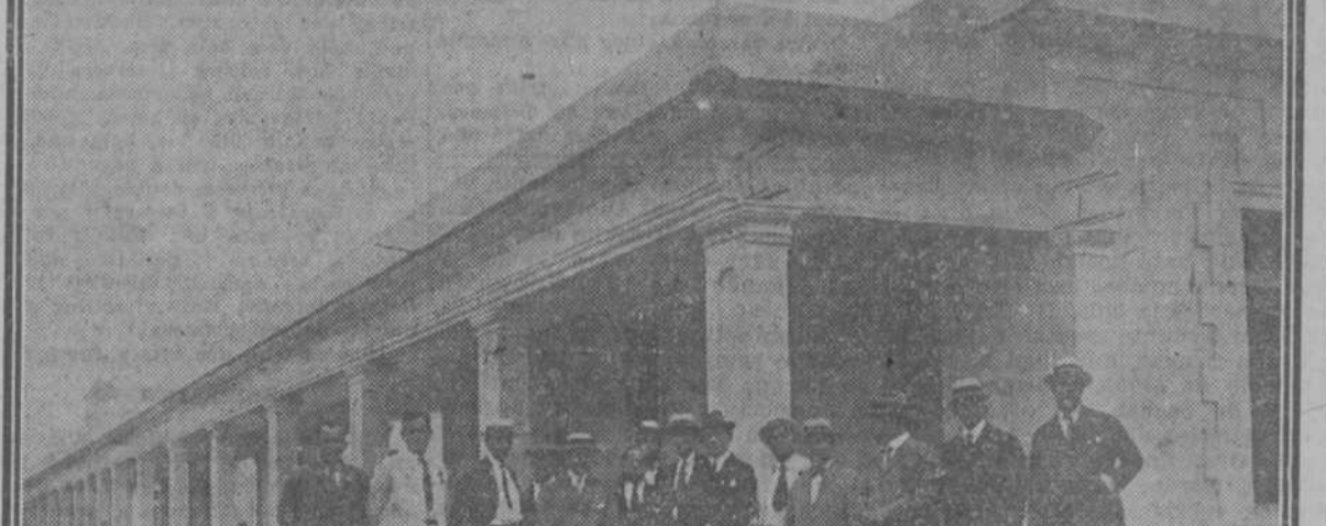
Un aspecto de los cinco pabellones que están al terminarse, dos para hombres y dos para mujeres, y uno de Cirugía.

La fiesta resultó de lo más cordial, de lo más amable, celebrándose en la casa escuela de las enfermeras, un hermoso edificio de moderna donde la limpieza es de lo más esmerado, donde todo brilla y reluce, donde se nota la mano de quien padece el hambre y el frío. La fiesta resultó de lo más cordial, de lo más amable, celebrándose en la casa escuela de las enfermeras, un hermoso edificio de moderna donde la limpieza es de lo más esmerado, donde todo brilla y reluce, donde se nota la mano de quien padece el hambre y el frío.