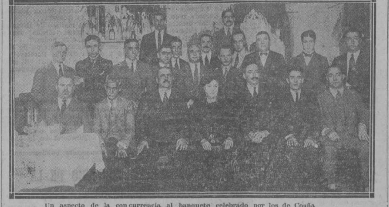
Un aspecto de la concurrencia al banquete celebrado por los de Coaña