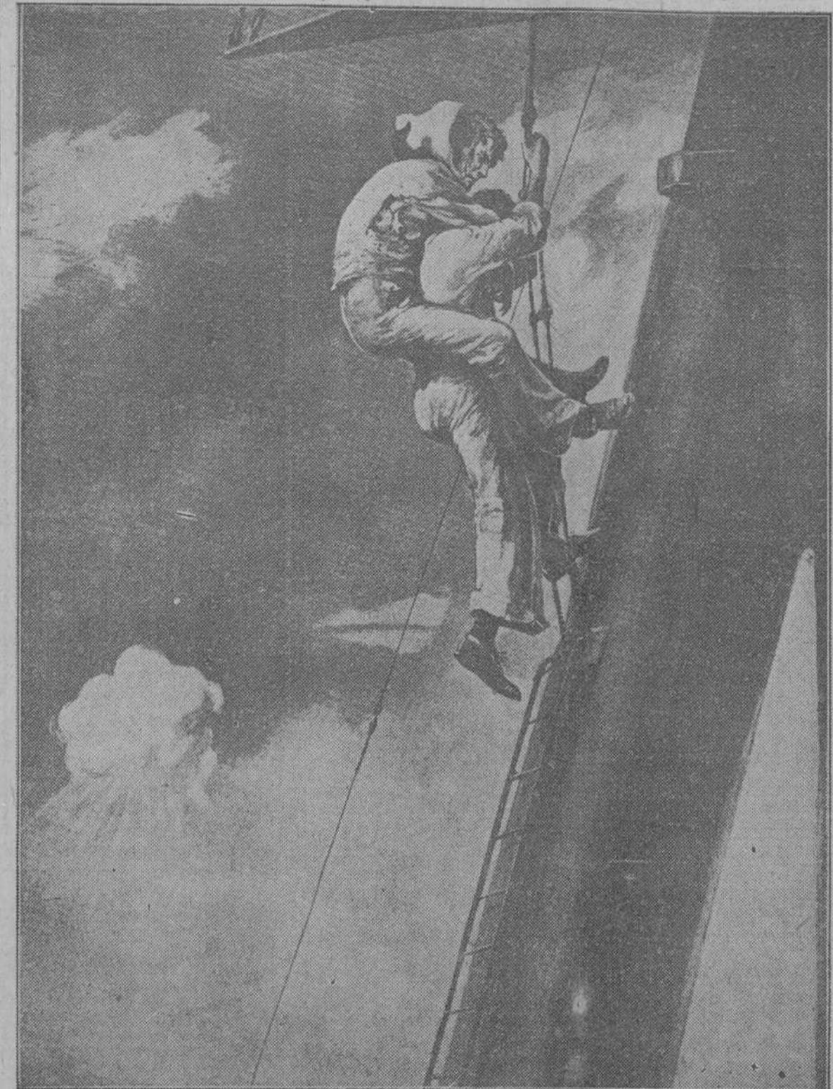
(Dibujo de Leblanc)