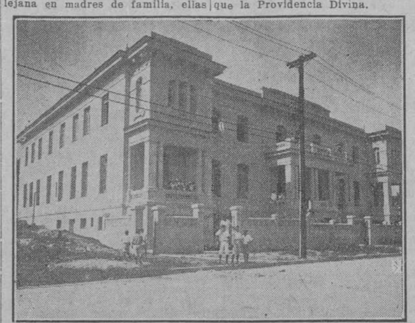
Exterior del magnífico edificio del Colegio de las Religiosas Filipenses.