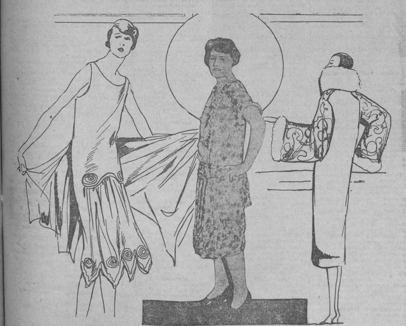
La ilustración del centro representa un elegante vestido de calle, de voile color rojo tomate, plegado sobre el pecho.