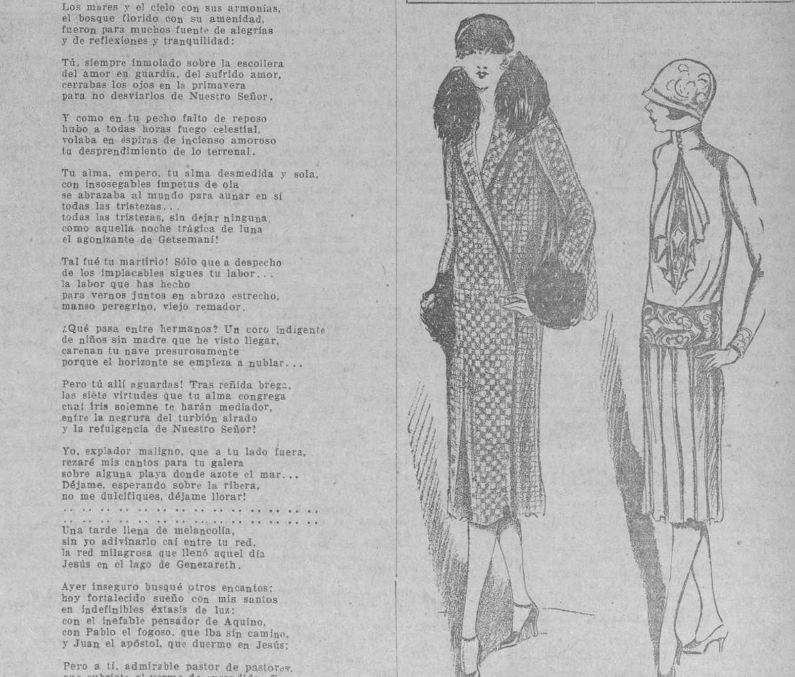
Modelo de traje de calle, de crepe gris con adornos de color amaranillo y carmelita y cintura blanca. Modelo de traje de calle, de crepe gris con adornos de color amaranillo y carmelita y cintura blanca.