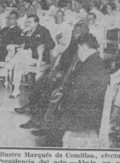
Homenaje en memoria del que fué ilustre Marqués de Comillas, efectuado anoche en el Casino Español. —En la parte superior, la Presidencia del acto.—Abajo, un aspecto de la concurrencia.

LA PRESIDENCIA Presidían tan solemne acto, el señor Ministro de España, el mar-