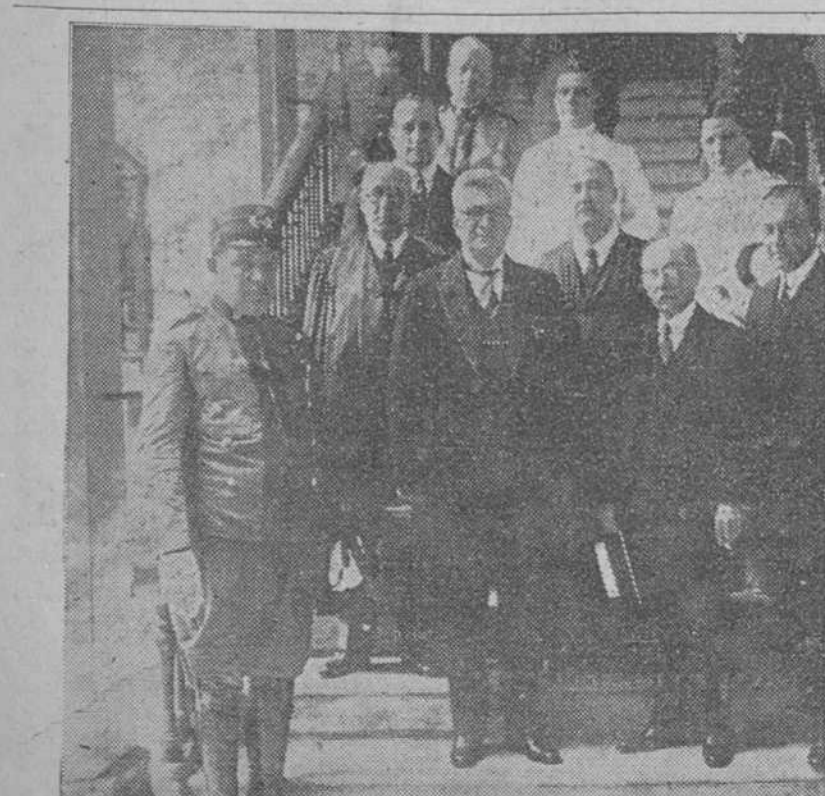
El Presidente de la República, el del Tribunal Supremo, y los Secretarios de Justicia y de la Presidencia, después de asistir a la apertura de los Tribunales.

LOS FRANCESES COMBATEN HACIENDO TRES DIAS PARA CAER SOBRE LOS BENIURRAGUELES MELILLA, Marruecos español, septiembre 1. (Associated Press).—Según confidenciales recibidas en