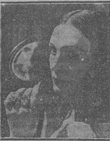
una de las superproducciones cinematográficas en la que se demuestran todos los poderosos recursos del arte silente, que permite aunar en un espectáculo todos los alicientes que agradan al público.

Esta es la última exhibición de esta gran película en Payret. Mañana reposición en Copia absolutamente nueva de la grandiosa película de la Universal, titulada: "EL JOROBADO DE NUESTRA SEÑORA DE PARIS", la obra máxima de la cinematografía americana y del coloso actor Lon Chaney. El Domingo MATINEE SUPERESPECIAL, para los niños. Todo nuevo en Cuba, estreno de tres comedias de Mac Sennett, estreno de la serie "EL VALLE ENCANTADO" y de MISERIA y OPULENCIA, por el célebre Jack Charlot el otro yo de Charles Chaplin.