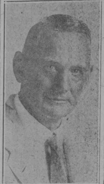
Esta es la vera estirpe de ocho seauziz, el coach de remos del Habana Yacht Club...