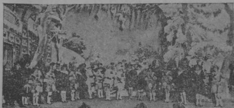
LA DANZA DE LAS LIBELULAS. Una de las más interesantes escenas de la famosa ópera de Lehar y Lombaro que esta noche estrena en Payret la Compañía Esperanza Iris.

Esta noche sube a escena por primera vez en el rojo coliseo La Danza de las Libélulas. Trávesa, festiva, con guisos de París y sonrisas de Viena—Franz Lehar es un enamorado de París, y en todas sus obras pinta a la Villa lumina: el tributo de un cuadro—esta ópera cuya dorada banalidad ilumina el brumoso paisaje escocés, es digna de la fama conquistada.