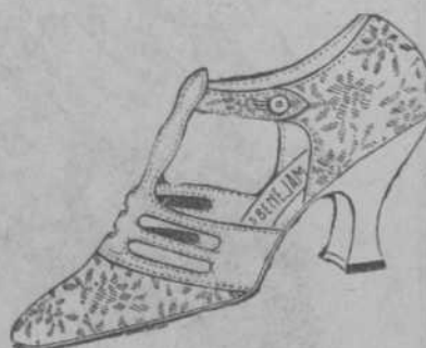
MODELO DE LUJO 5620

De tisú de plata con hebillas de plata con piedras $45.00. Tenemos otras hebillas mas pequeñas que vendemos a $25.00, 30.00, 35.00 y 40.00.—entiendase hebillas y zapato—según el tamaño y calidad de las hebillas. Con adornos de tisú a $20.00 y 22.00. Escotados a $18.00.