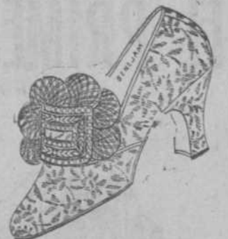
MODELO DE LUJO 859

Preciosa nuestra colección. Los modelos mas nuevos, genuinos de París, son los que tenemos. Doce estilos diferentes a cual mas bonitos y una gran variedad de hebillas finas, de plata con piedras.