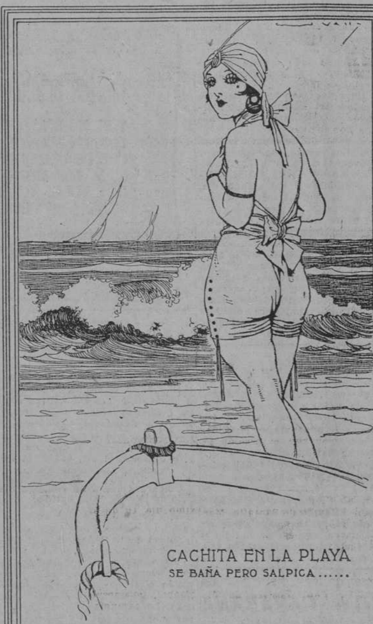
CACHITA EN LA PLAYA SE BAÑA PERO SALPICA.....