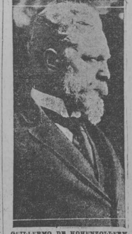
GUILLERMO DE HOHENZOLLERN

NEW YORK, Mayo 13. Llegaron el "Essequibo", de la Habana, y el "Belita", de Baracoa. FILADELFIA, Mayo 13. Saló el "Mar Adriático", para la Habana. NORFOLK, Mayo 13. Saló el "Karmoy", para Cienfuegos. NUEVA ORLEANS, Mayo 13. Llegó el "Chalmette", de la Habana. Salieron el "Carrabulle", para Cienfuegos, y el "Dulcino", para Bane