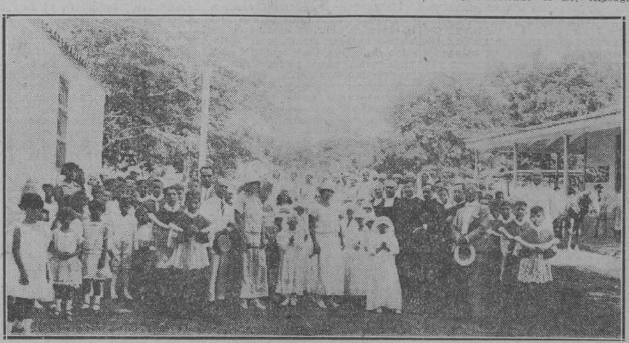
Grupo de niños que hicieron la primera comunión y concurrentes al hermoso acto

Los Hermanos del Colegio de La Salle del Vedado, no se concretan únicamente a educar los niños en su gran plantel.