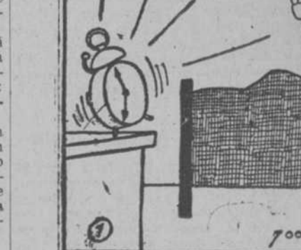
1. 7:00 A.M.

El "DIARIO DE LA MARINA" es el periódico mejor informado en asuntos de sports