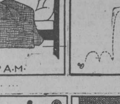
4. Cuando se pierde un botón se falta a la obligación.