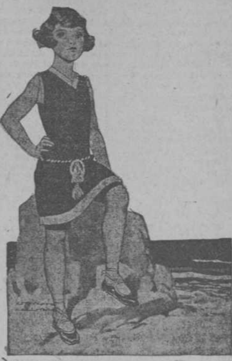
No. 1395 Traje de baño para niña, de lana, enterizo, en los colores verde claro, prusia, fresa y negro. Con biés blanco y cinturón. Para edades de 10 a 16 años. Precio: $9.25.

Su tournée por el interior ha sido una sucesión de éxitos. Repetirá el viernes con su Compañía de Revistas Mejicanas para actuar hasta el domingo primero de Julio.