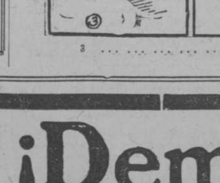
3. Cuando se pierde un botón se falta a la obligación.

Kinley, las siguientes palabras: "Se acerca el tiempo en que boagamos que intervinir en Cuba". Y un año después, en Diciembre de 1897, el Presidente Mc. Kinley se preguntaba "si no sería un deber impuesto a las obligaciones de los Estados Unidos, a la civilización y a la humanidad, intervenir por fuerza en la isla de Cuba".