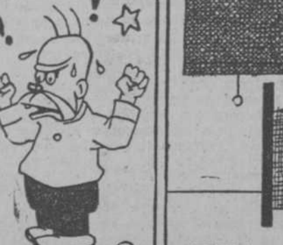
5. Cuando se pierde un botón se falta a la obligación.