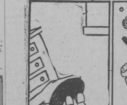
2. Se le cayó el botón del cuello.