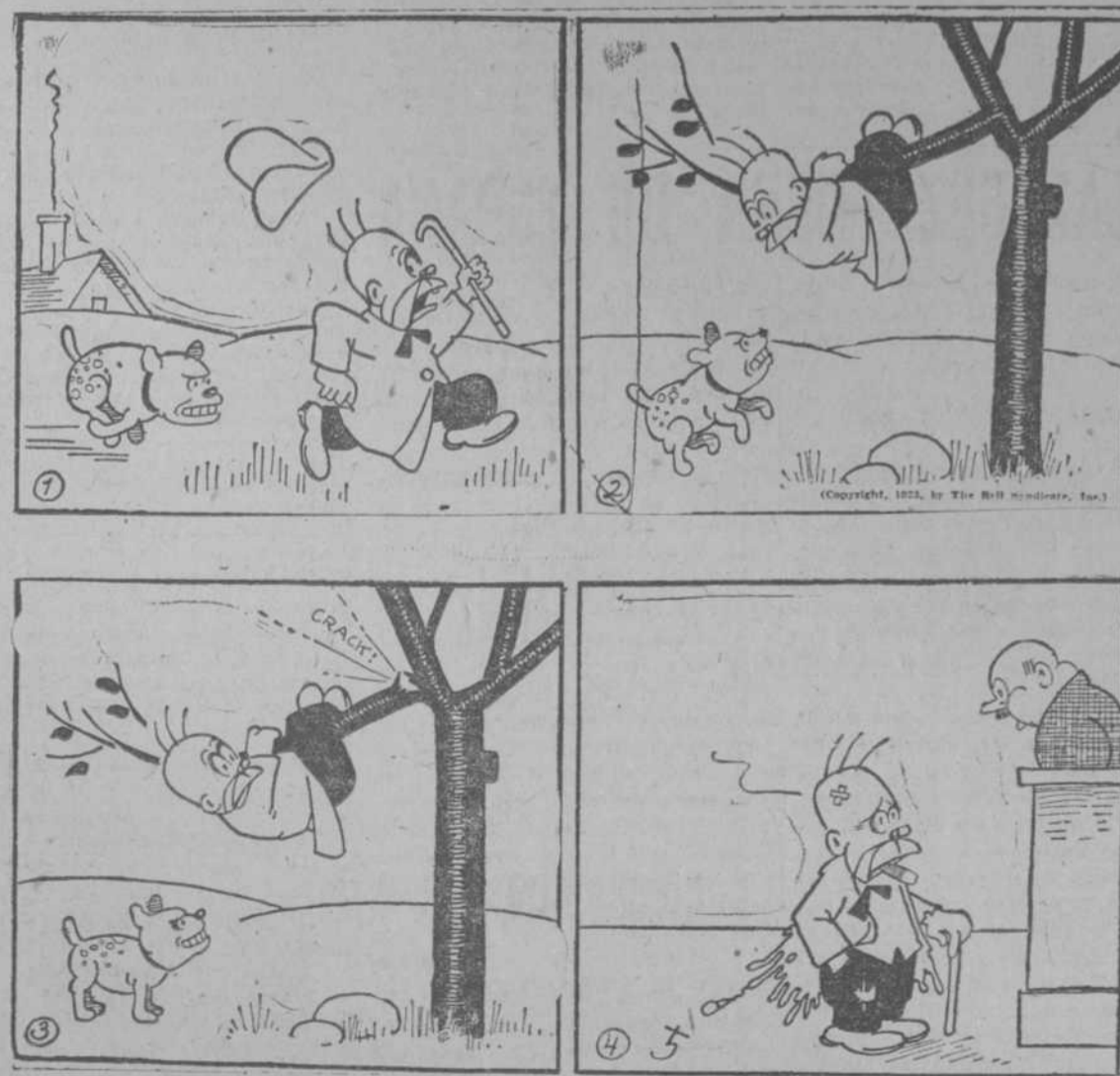
Inspector, ¿puede usted colocarme en la recogida de perros?