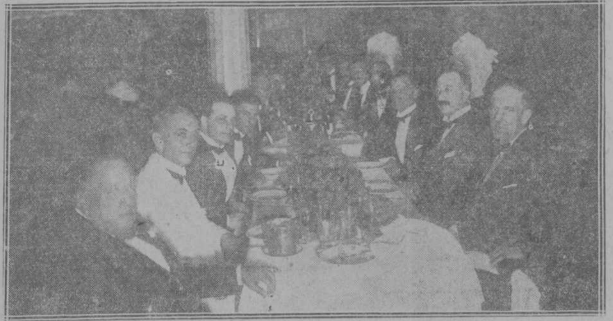
La presidencia del banquete efectuado anoche a bordo del vapor "Cuba"