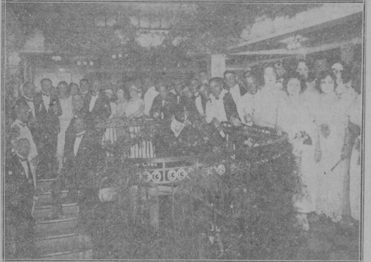
Aspecto de la concurrencia en el baile celebrado a bordo del vapor "Cuba"