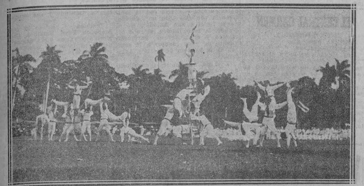
Un "momento" de los ejercicios realizados por alumnos de Belén durante el "Field Day" de ayer.