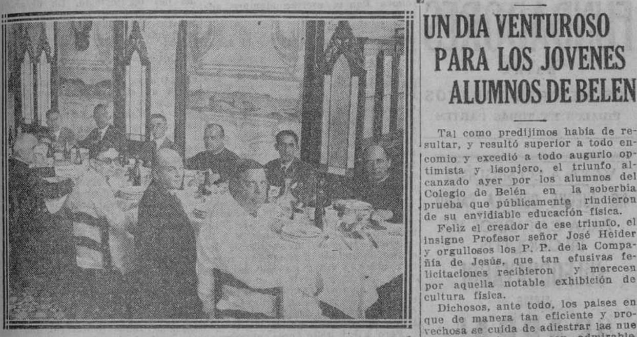
Un aspecto del banquete servido, al mediodía, en la Casa de Camo, a los invitados de honor al "Field Day."