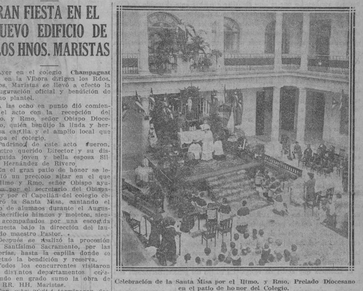
Celebración de la Santa Misa por el Ilmo. y Rmo. Prelado Diocesano en el patio de honor del Colegio.