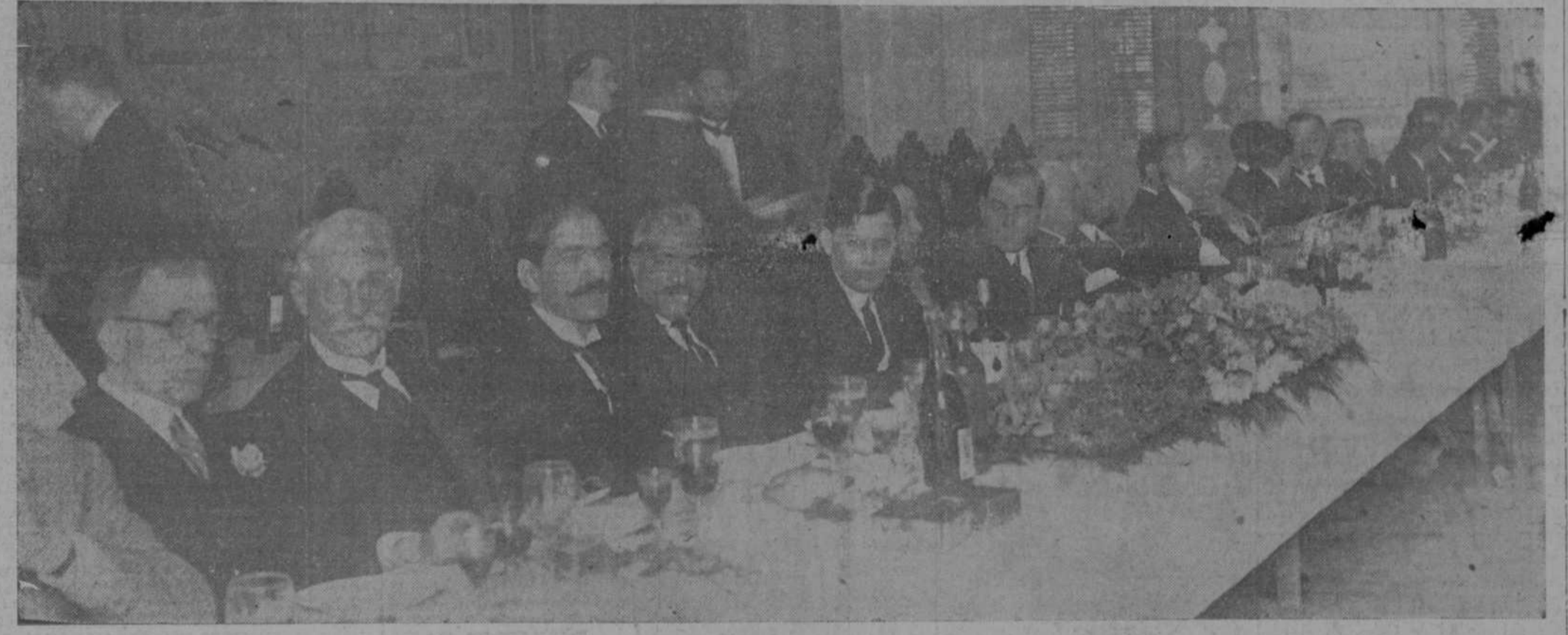
La presidencia del banquete celebrado ayer en los salones del Centro Gallego, en honor nuestro Director.

Acompañado de una Comisión de Centro de Detallistas y Centro de Cafés, llegó al Centro Gallego el doctor Rivero. Y su llegada fué objeto de una grandiosa ovación que le tributaron, así el público apostado a la entrada del Palacio de los gallegos, como la concurrencia que le esperaba en el salón.