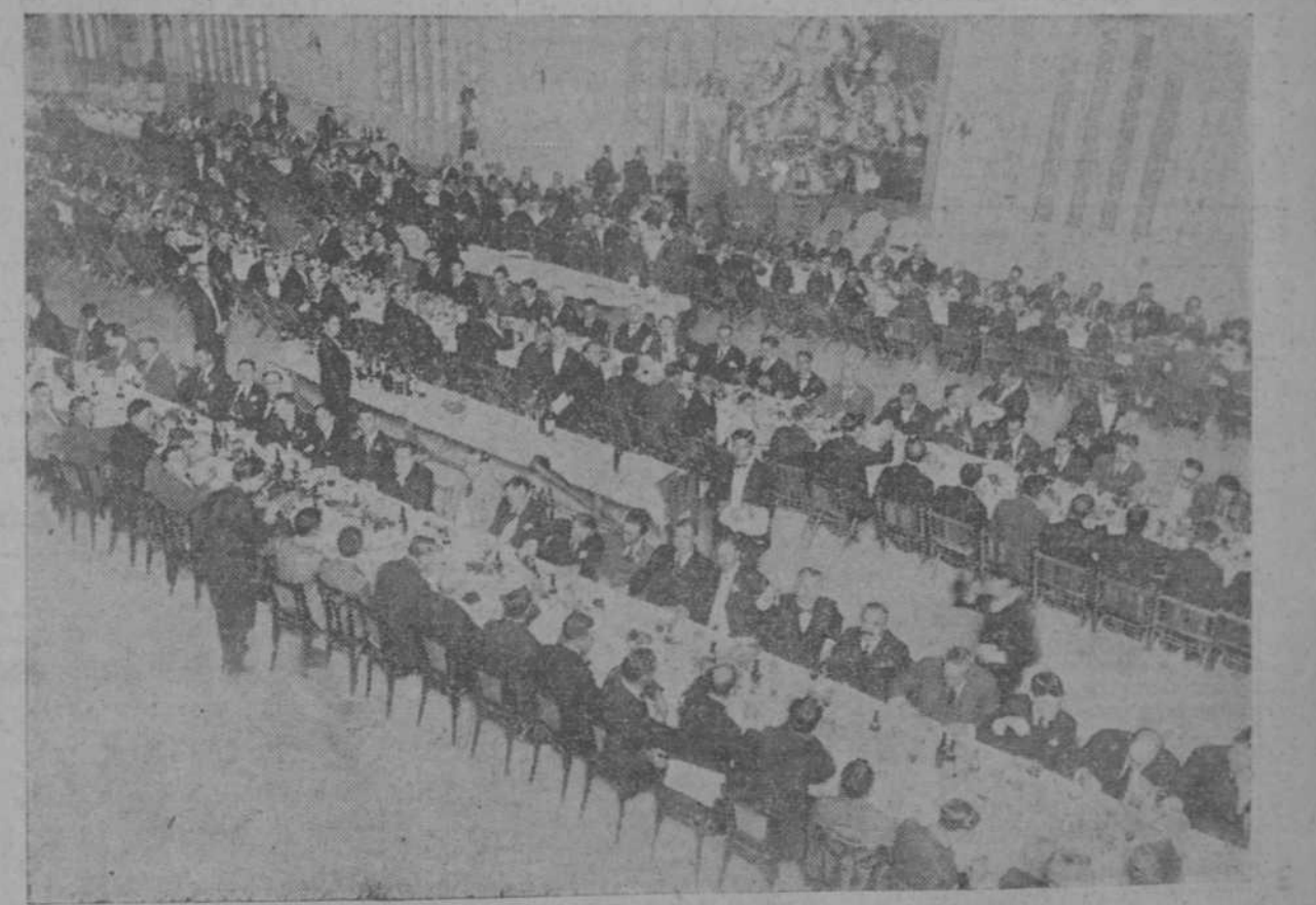
Un aspecto del banquete de ayer en el Centro Gallego.