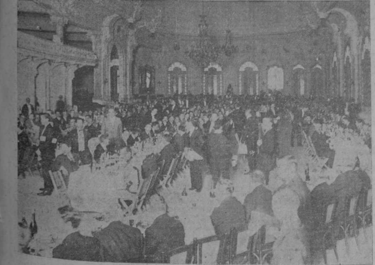
Otro aspecto del banquete de ayer en el Centro Gallego.