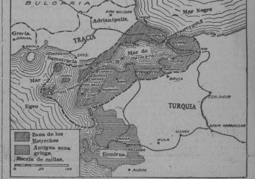
Mapa de los Estrechos y de las zonas neutrales europea y asiática, que han querido apoderarse los turcos violando las bases del armisticio de Mudania.

Se le considera entre los suyos, como un regenerador de Turquía, y ese movimiento de regeneración, se tradujo después en la revolución de los Jóvenes Turcos, y en arrojarse del trono a Abdul-Hamid, en 1908. Ya es hombre Medjid Effendi, de 58 años, y ha tenido tiempo, por tanto,