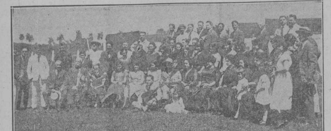
Aspecto general de la concurrencia en la "Sociedad de Cazadores de la Habana."

Somos los únicos fabricantes de los Palatinos número 2 para vender a cinco centavos al precio $4.49 el millar. Idem, número 1 para vender a dos centavos al precio $2.20 el millar y de las galletitas para señoras heladas, a $2.10 la lata, mercancía tan deseada por el público y conveniente para su negocio. Estos precios empezarán a regir desde el día 10 de Febrero en su plaza. Los pedidos para el campo se sirven con prontitud. C 781 alt. Ind. 25 A. VASILLAS DE CRISTAL "BACCARAT" Gran surtido. Muy baratas. Ferretería "LA LLAVE" Neptuno, 106, entre Campanario y Perseverancia, Habana.