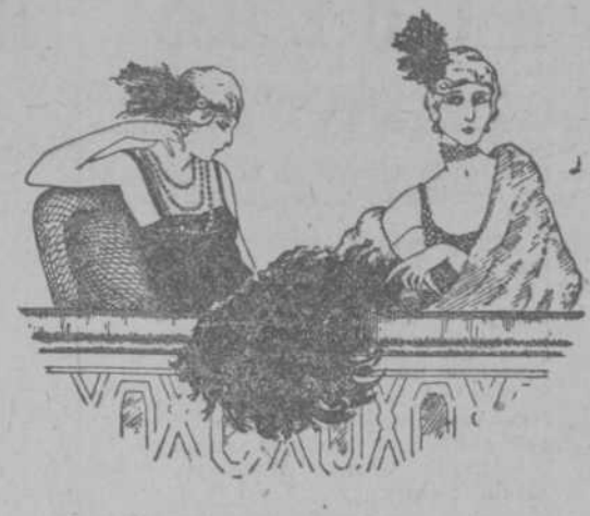
EL "PRINCIPAL DE LA COMEDIA"

AVENIDA DE ITALIA, 80; Y SAN RAFAEL, 38 Y 40