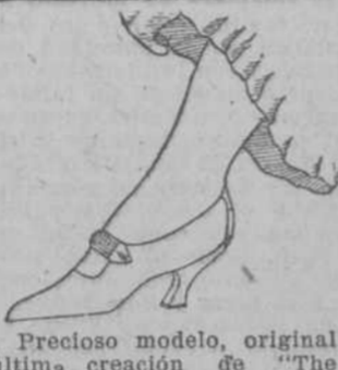
Preclara modelo, original última creación de "The High Artistic Corp." Brooklyn, N. Y.

de los Armand en la que abrían su roja corola las rosas matizando la blancura impecable del mantel.