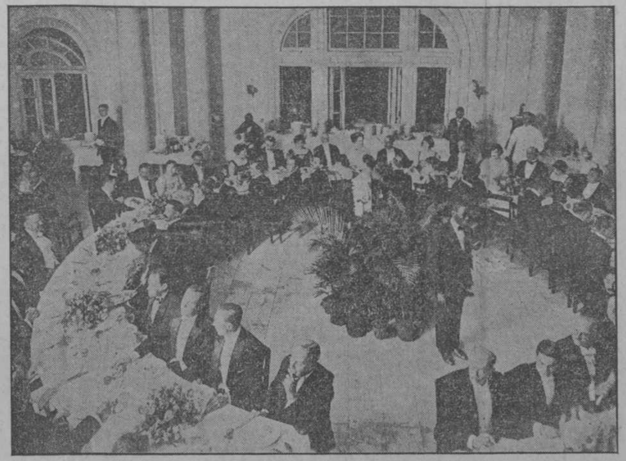
Un aspecto del banquete celebrado anoche.

Un día el de ayer movidísimo, tal vez de los mayores del Congreso, dedicado a leerse muchas de las ponencias señaladas y postpuestas de sesiones anteriores por verdadera falta de tiempo para cumplirlas.