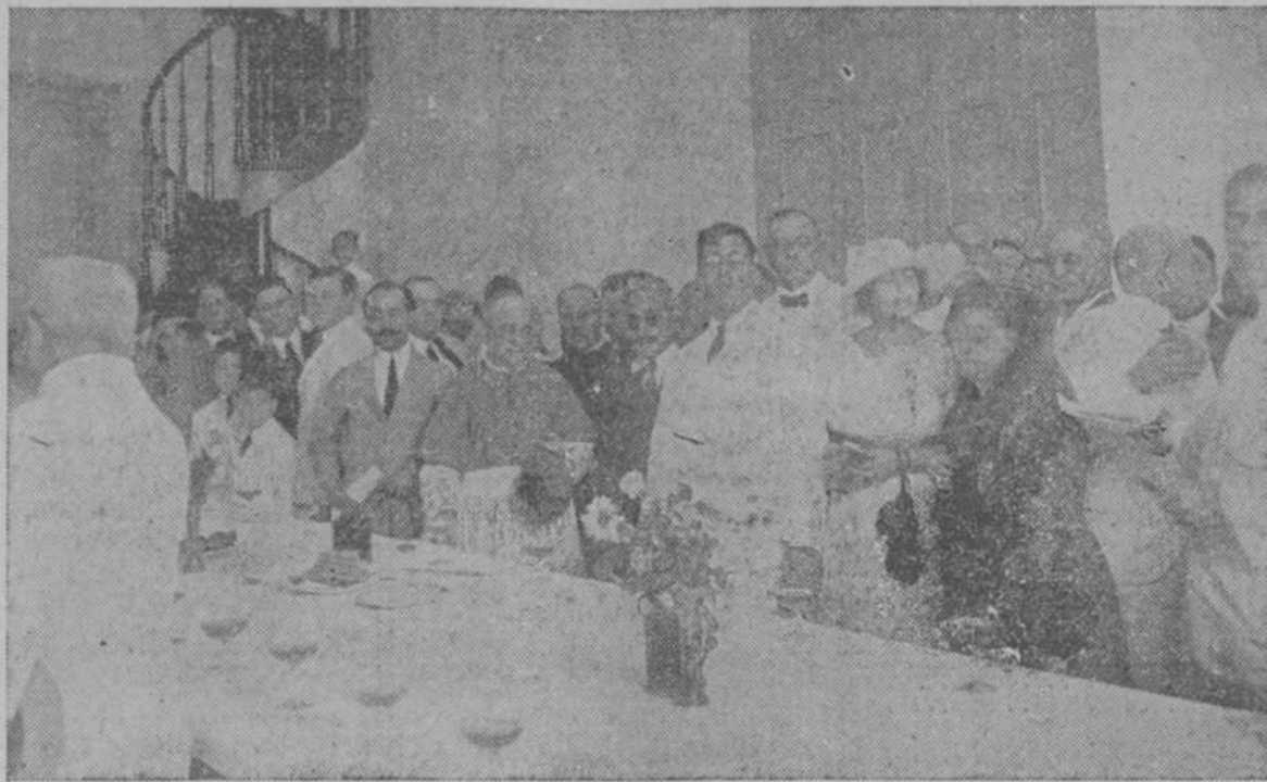
Monseñor Estrada y otros invitados a la inauguración del Santuario de la Virgen de Monserrat.