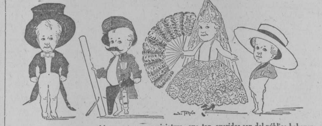
Los regocijantes e interesantísimos actores en miniatura, que tan queridos son del público habanero, vuelven esta noche, triunfadores como siempre al escenario del Teatro Payret.

¡Volvieron! Ya han regresado. Tras una lucidísima y prorechocha tournée en provincias, ya está de nuevo entre nosotros la siempre aplaudida y querida compañía infantil Valdivieso.