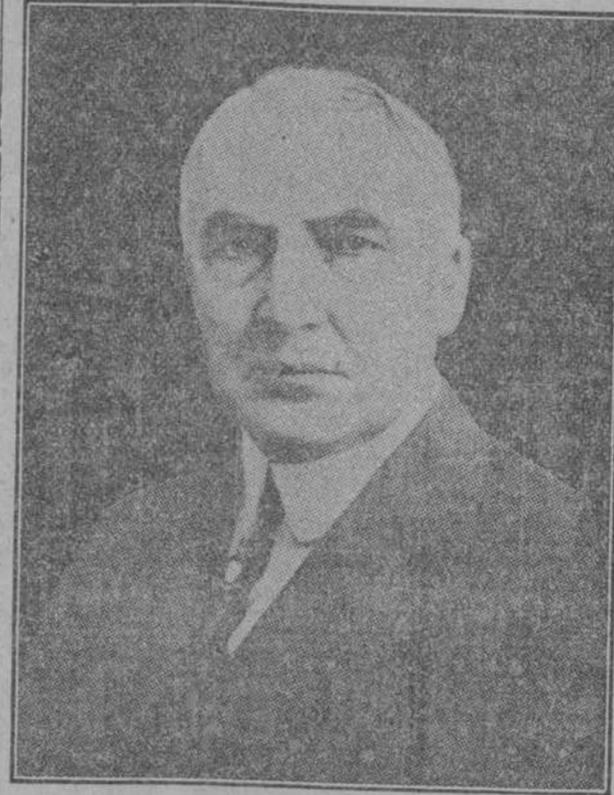
LOS SEÑORES WARREN G. HARDING Y CALVIN COOLIDGE, QUE TOMARAN HOY POSESION RESPECTIVAMENTE DE LOS CARGOS DE PRESIDENTE Y VICEPRESIDENTE DE LOS ESTADOS UNIDOS DE AMERICA

Se reafirma en la postura contra los monopolios, que inflara en anteriores Administraciones. Declara que en las actuales condiciones económicas del mundo un programa económico es casi imposible, pero se ratifica en los principios proteccionistas que ha seguido siempre el partido y promete la revisión de las tarifas de Aduana en cuanto sea necesario para asegurar los mercados del país a las industrias nacionales. Sobre este punto Mr. Harding precisó poste-