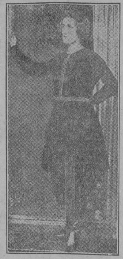
Mrs Herbert Asquith