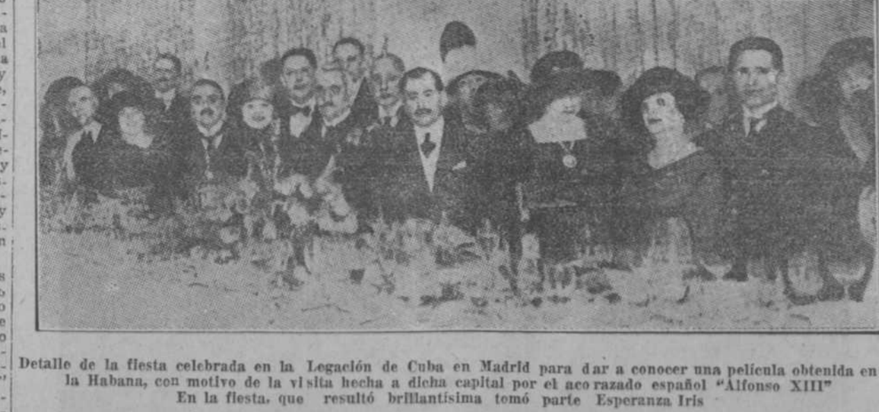
Detalle de la fiesta celebrada en la Legación de Cuba en Madrid para dar a conocer una película obtenida en la Habana, con motivo de la visita hecha a dicha capital por el acaudado español Alfonso XIII.

LA MANIFESTACION ESCOLAR. SOLEMNE SESION DEL AYUNTAMIENTO EN LA UNIVERSIDAD. RE- CEPCION EN EL PALACE HOTEL. TROAS FIESTAS