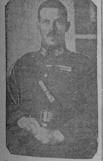
Alejandro de Grecia, rey de los helenos, que falleció ayer a consecuencia de una infección que le produjo una pierna