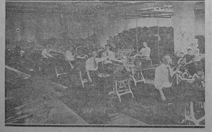
Sobrecito Departamento de Planchado de la Tintorería MAJESTIC, equipado con tipos especiales de máquinas, únicas en Cuba.

"MAJESTIC" ES UNA VERDADERA TINTORERIA Planta en edificio propio; Infantería y J. Peregrino. TELEFONOS: A-5866; M-8808.