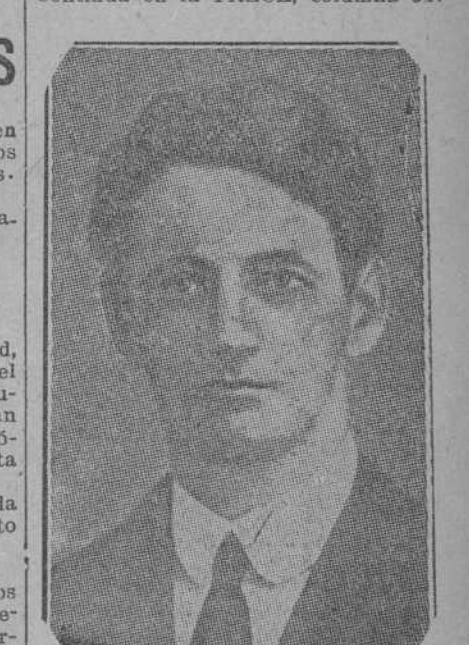
Terence Mac Swiney, Lord Alcalde de Cork, falleció ayer después de setenta y tres días de ayuno voluntario, que sufrió en la cárcel de Brixton, Londres, donde fué recluido bajo la acusación de estar complicado en los atentados de los cinco feliers en Irlanda