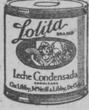
La Leche Lolita es tan deliciosa como saludable.

La pureza de la leche que Ud. consume es directamente responsable de su salud. La leche constituye un elemento esencial para el desarrollo del niño y es indispensable para la reconstitución del sistema. Reune elementos altamente nutritivos que reconstruyen los tejidos y los huesos y conservan la vida al mismo tiempo que promueven el desarrollo, como no lo hace ningún otro alimento.