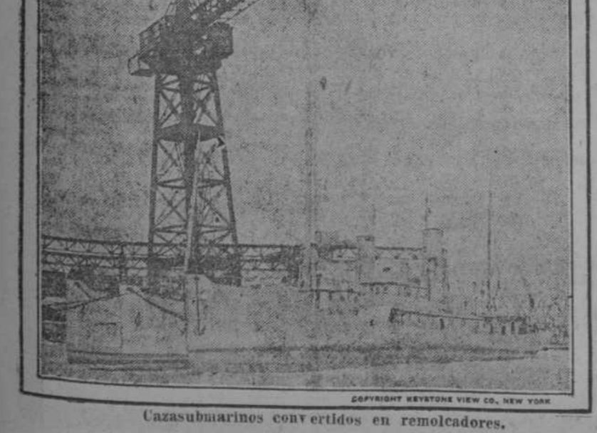
Casasubmarinos convertidos en remolcadores.