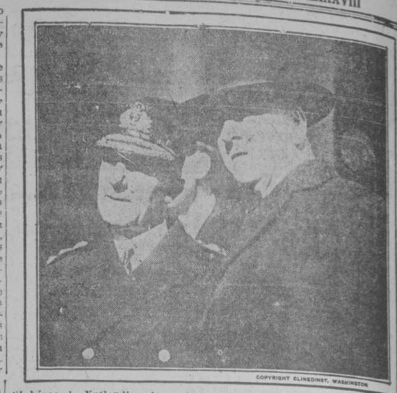
El héroe de Yutlandia, almirante Guillermo García, acompañado del Secretario de Marina de los Estados Unidos Mr. Daniel

para aprender el verdadero método pedagógico y comparar con esos finales de explicaciones en que se causa y aburre a los oyentes con problemas citas, fechas y frases. El doctor Buero pronunció su conferencia acerca del Arbitraje entre las naciones, y si la elocuencia que demostró es mucha y de buena calidad, hay en su visita a la Universidad y en su disertación algo más interesante y que aprovecha más a la juventud, su presencia, su nombre—que ya ocupa alto sitio entre los internacionalistas americanos—y su optimismo sano y franco es la mayor lección para la juventud universitaria porque cuando los que esperamos, desde nuestros bancos de estudiantes, que se abran las puertas para la lucha en la vida, vemos a la juventud triunfante, sentimos que se nos multiplican las fuerzas y como que se derrumban las montañas de obstáculos que en el horizonte del porvenir parecen divisarse; ver como hombres estudiosos y de voluntad ocupan ya altos puestos sin que aun se vea en sus cabellos la nieve del cambio, ni en sus rostros las arrugas del cansancio, son lecciones fecundas de energía. Y por estos ejemplares vividos debían sustituirse las lecciones subsidiarias de los Marden y de los Smiles.