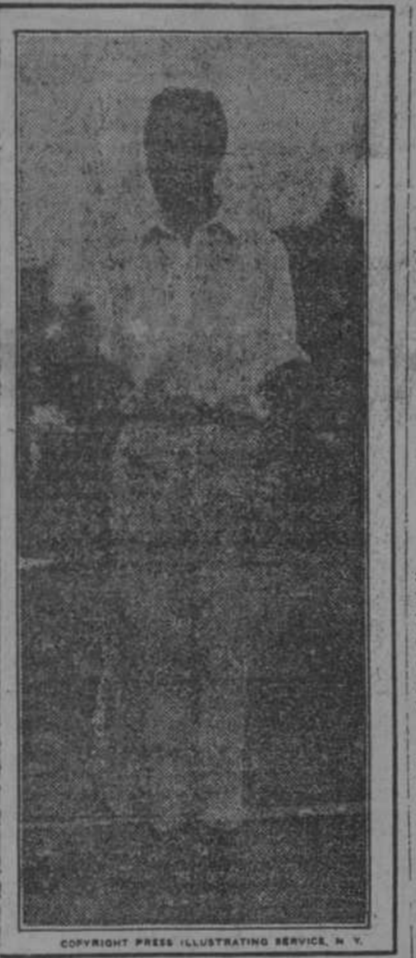
William M. Johnston, de San Francisco, campeón mundial de Tennis.