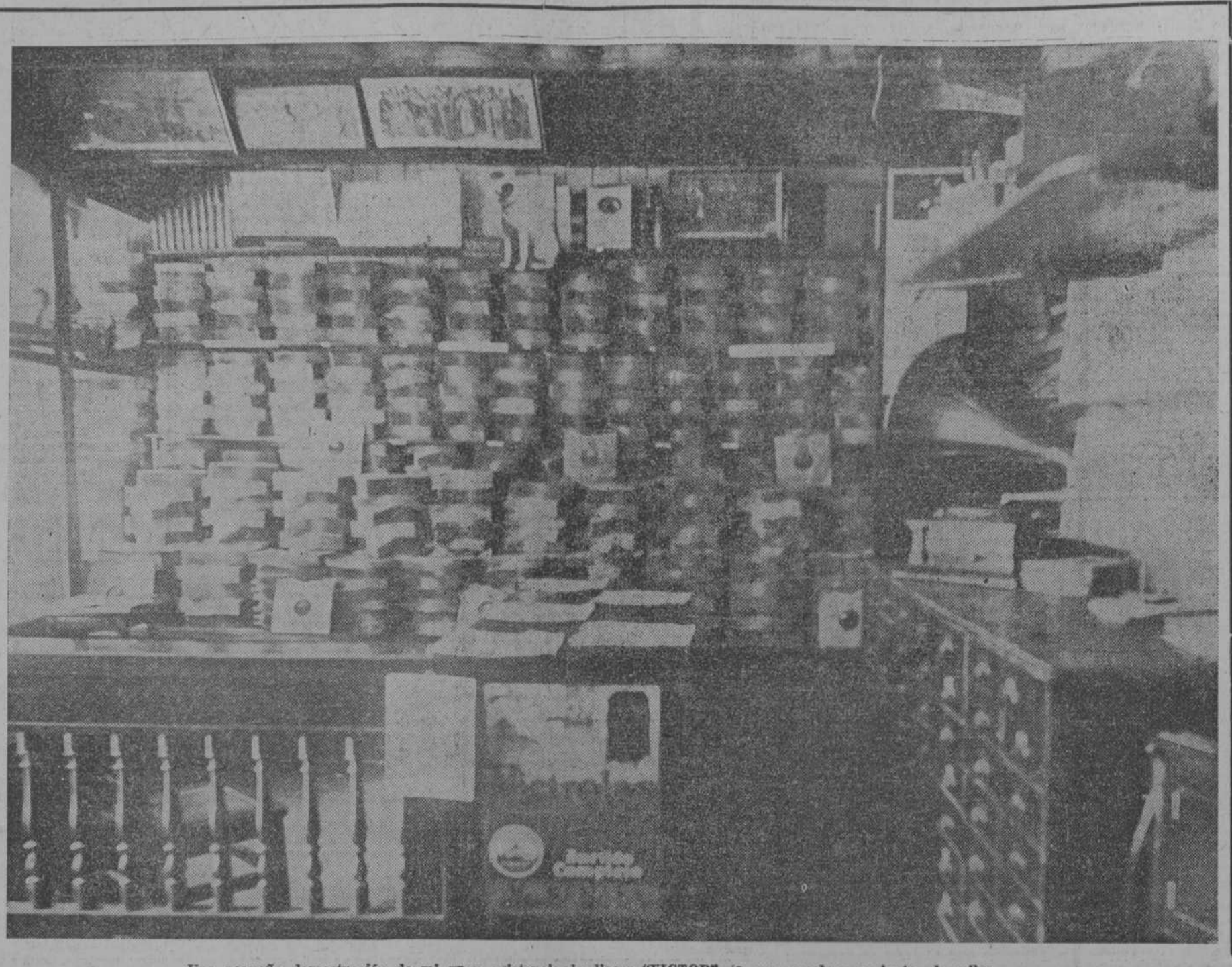
Una pequeña demostración de mi gran existencia de discos "VICTOR", ia que se eleva a cientos de miles.

Los Discos de Sello, Rojo, que hasta aquí Se vendían a $2-50, $3-75, $5-00, $6-50, $7-50 y $8-75 Se venden a $1-25, $2-00, $2-50, $3-25, 3-75, y $4-50