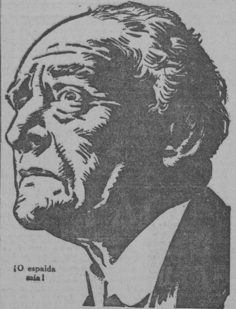
¡O espalda mía!

que han ejercido su poder curativo sobre el sitio dañado, esto es, los riñones y la vejiga. Las Pildoras De Witt son pequeños maravillosos obreros que van en derecha á los riñones primero, y