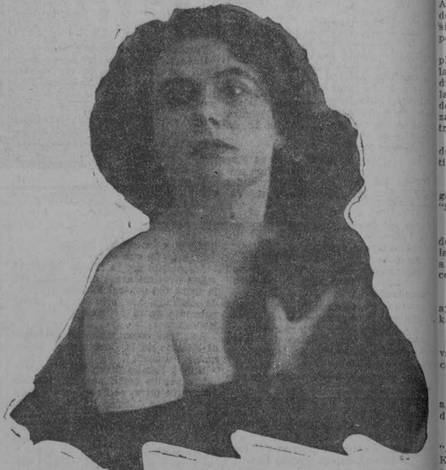
Su arte no se cristaliza ni se agota. Todas las expresiones espirituales de los sentimientos humanos se exteriorizan en ella a través de una sensibilidad estética que es privilegio de pocos artistas, y que es fruto de su constante afán de belleza y de su antenaz de elevación espiritual. Ella hace "vivir" en el sentido más profundo y humano, sus acciones artísticas. ¿Qué importa que sea mudo su arte, cuando la determinación de los sentimientos que interpreta surge poderosamente, irresistiblemente de la elocuencia maravillosa de su gesto?

Para comodidad de las innumerables familias simpaticizadas de la Bertini, la empresa ha acordado que en las tandas de 5.1¼ y 9.1½ las lunetas sean numeradas, para que puedan adquirirlas con anticipación en la taquilla de "Fornos" de 11 a 11 o pedir las al teléfono M-2881.