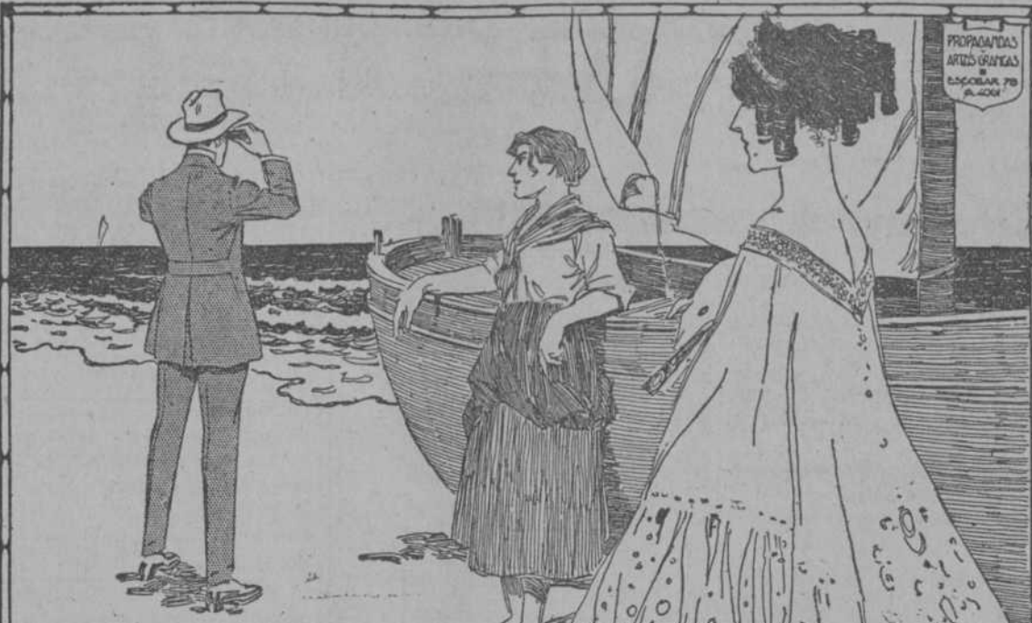
DESDE LA PRINCESA ALTIVA A LA QUE PESCA EN BUIN BARCA.