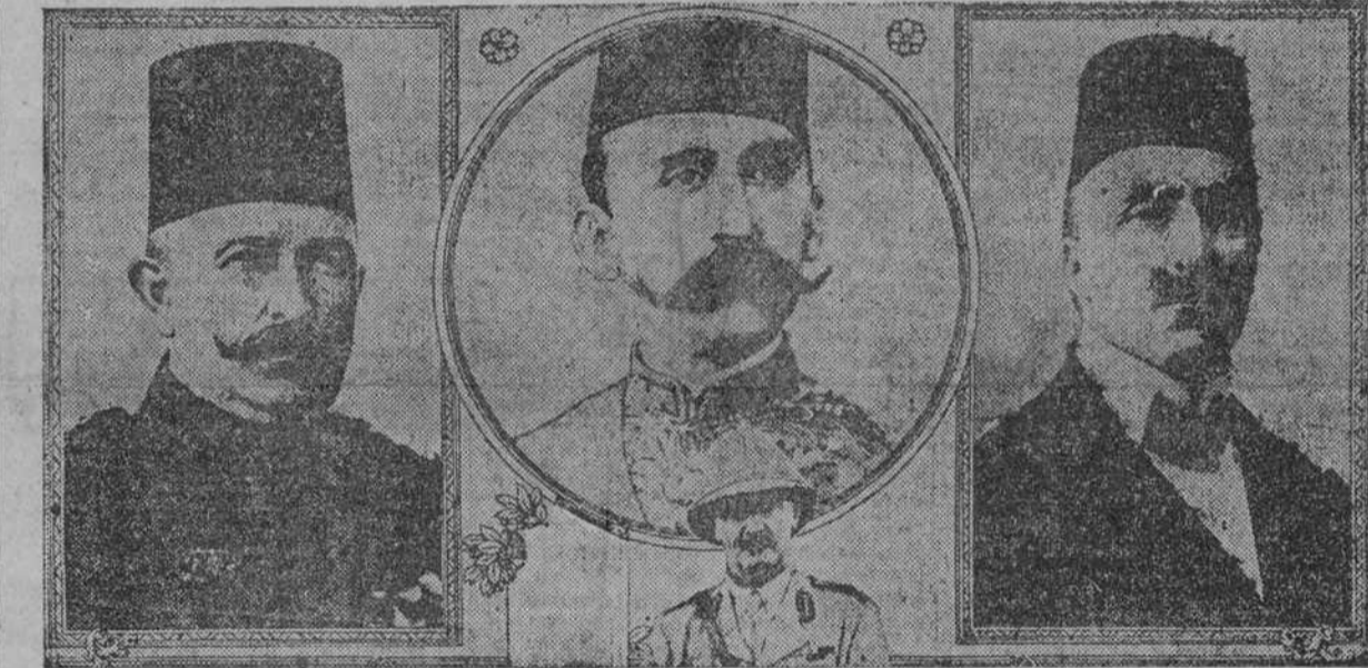
KHEDIVE ABBAS II depuesto y expulsado