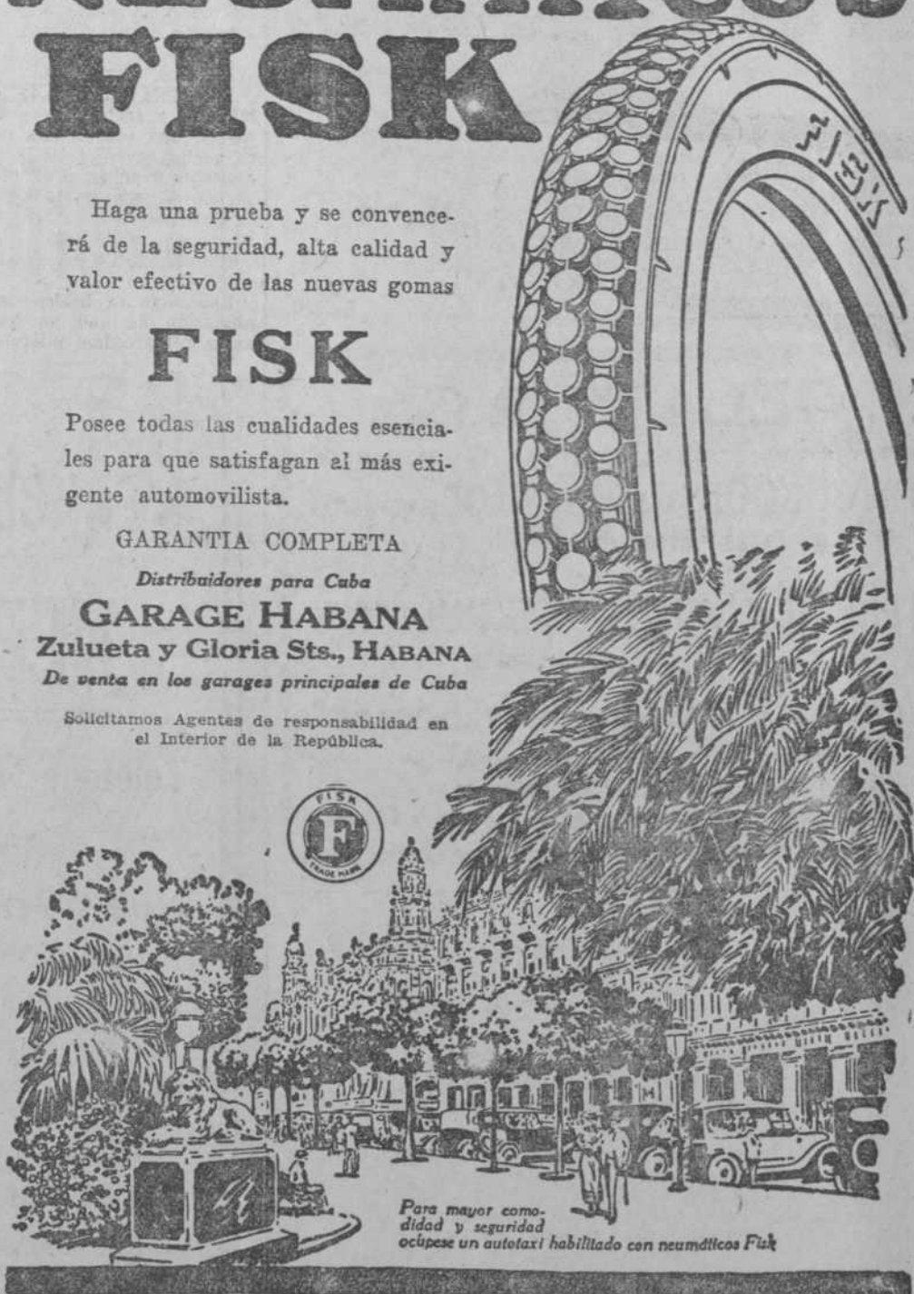
Para mayor comodidad y seguridad ócupese un autotaxi habilitado con neumáticos Fisk

Solicitamos Agentes de responsabilidad en el Interior de la República.