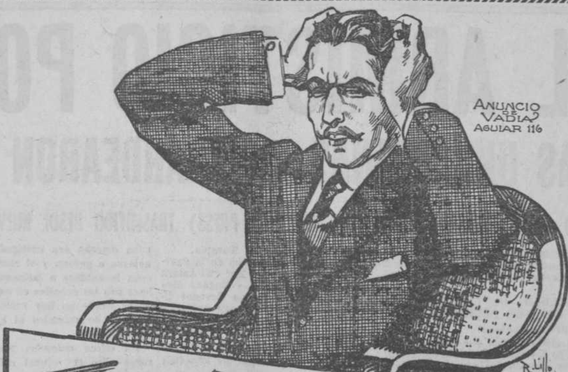
ANUNCIO VADIA AGUIAR 116