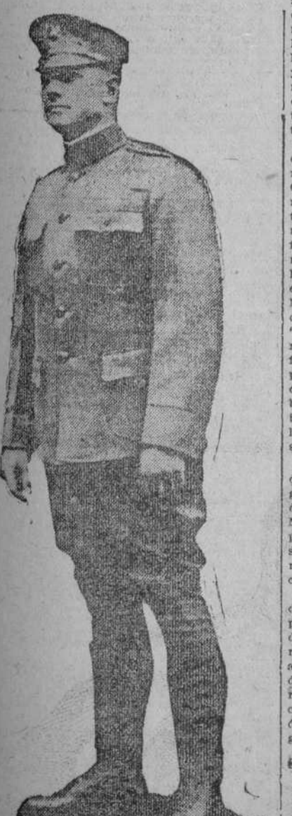
Primera fotografía del Capitán Christy Mathewson, ex-famoso jugador de base ball, hoy oficial de la Armada de los Estados Unidos.