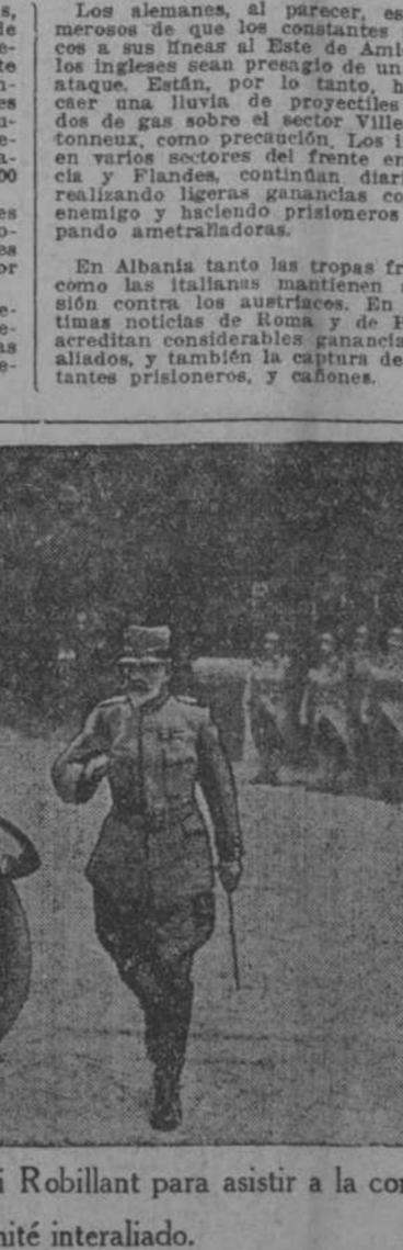
Llegada del general italiano Di Robillant para asistir a la conferencia del comité interaliado.

Los alemanes, al parecer, están temerosos de que los constantes mordiscos a sus líneas al Este de Amiens por los ingleses sean preámbulo de un pronto ataque. Están, por lo tanto, haciendo caer una lluvia de proyectiles cargados de gas sobre el sector Villers Bretonneux, como precaución.