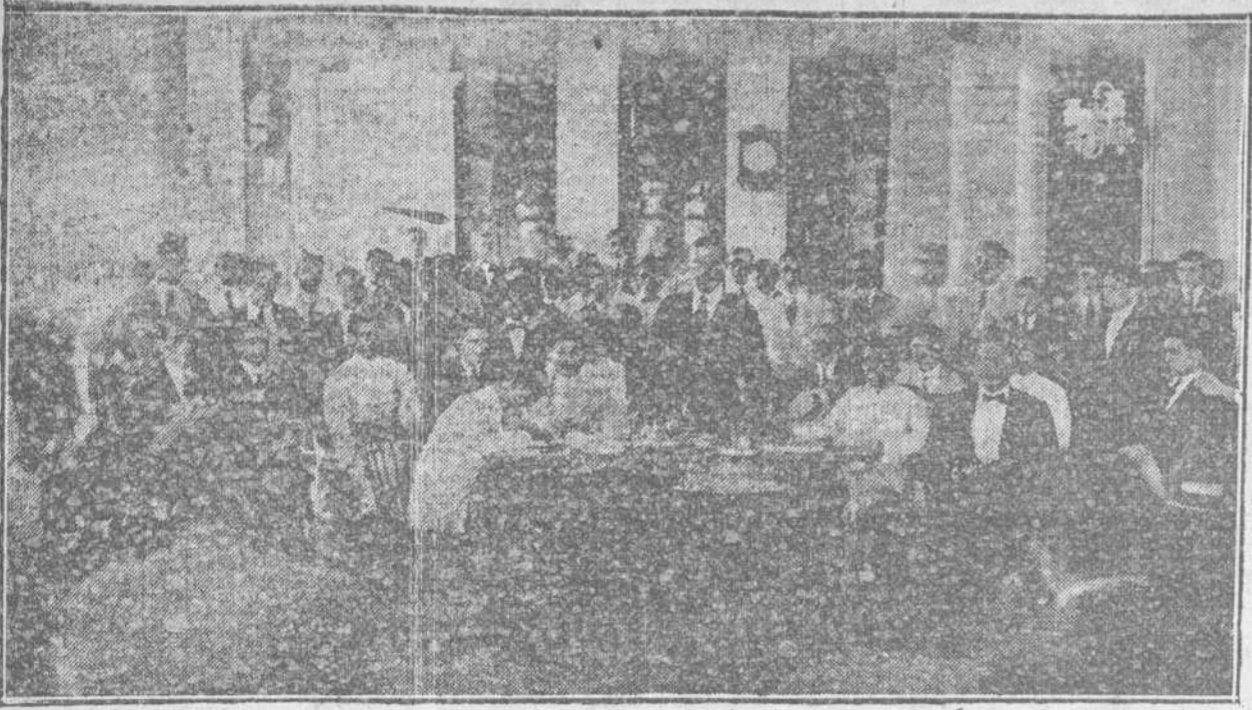
La Asamblea de los Dependientes del Comercio, en la Asociación de Dependientes, sobre la Ley del Cierre.

Se pedirá al Congreso la modificación de la Ley del Cierre.