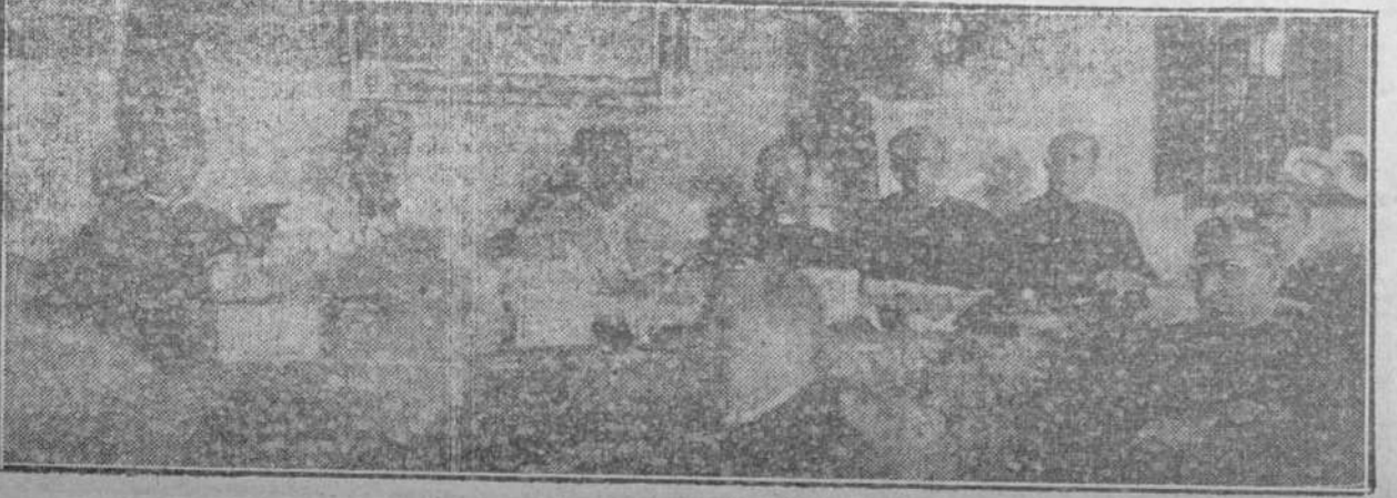
Presidencia de la distribución de premios en las Escuelas Pías de Guanabacoa.